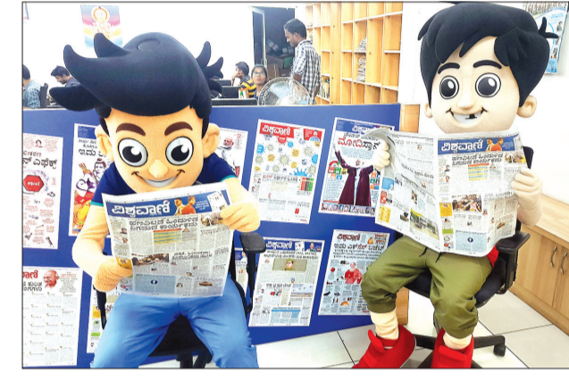
ನಿಕಲೋಡಿಯನ್ ಚಾನೆಲ್‌ನಲ್ಲಿ ಪ್ರಸಾರವಾಗುವ ಚಿಣ್ಣರ ಮತ್ತು ಬಂಟಿ ಎನ್ನುವ ಹೊಸ ಕಾರ್ಟೂನ್ ಕಾರ್ಯಕ್ರಮದ ಪಾತ್ರಗಳು ವಿಶ್ವವಾಣಿ ಕಚೇರಿಗೆ ಆಗಮಿಸಿ, ಪತ್ರಿಕೆ ಓದುತ್ತಿರುವುದು.

ಸೇರಿದಂತೆ ಲಸಿಕಾ ಕಾರ್ಯಕ್ರಮದಲ್ಲಿ ಹಿಂದುಳಿದಿರುವ ಕೆಲವು ಜಿಲ್ಲೆಗಳು ಲಸಿಕಾ ಪ್ರಮಾಣ ಇನ್ನಷ್ಟು ಹೆಚ್ಚಿಸಲು ಆಸಕ್ತಿ ವಹಿಸುವಂತೆ ಜಿಲ್ಲಾಧಿಕಾರಿಗಳಿಗೆ ಸಲಹೆ ನೀಡಿದರು. ಗ್ರಾಮೀಣ ಭಾಗದಲ್ಲಿ ಲಸಿಕೆ ಹಾಕುವಾಗ ನಿರೀಕ್ಷಿಸಿ ಕ್ರಿಯಾ ಯೋಜನೆ ರೂಪಿಸಿಕೊಂಡು ಪ್ರತಿಯೊಬ್ಬರಿಗೂ, ಅರ್ಹ ಫಲಾನುಭವಿಗಳಿಗೆ ಲಸಿಕೆ ಹಾಕುವಂತೆ ಅಧಿಕಾರಿಗಳು ಕ್ರಮ ಜರುಗಿಸಬೇಕು ಹಾಗೂ ರಾಜ್ಯದಲ್ಲಿ ವಿತರಣೆ ಅತ್ಯಂತ ವೇಗವಾಗಿ ಲಸಿಕಾ ಕಾರ್ಯಕ್ರಮವನ್ನು ಯಶಸ್ವಿಗೊಳಿಸುವಂತೆ ಎಲ್ಲಾ ಜಿಲ್ಲಾಧಿಕಾರಿಗಳಿಗೆ ಸೂಚಿಸಿದರು.