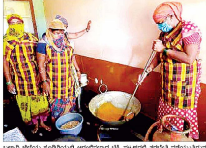
ಬಳ್ಳಾರಿ ಜಿಲ್ಲೆಯ ಕೂಡ್ತಿಗಿಯಲ್ಲಿ ಆರಂಭಿಸಲಾದ ಬೆಕ್ಕಿ ಘಟಕದಲ್ಲಿ ತರಬೇತಿ ಪಡೆಯುತ್ತಿರುವ

ಇರು ಉತ್ತರ, 4ನೇ ಮಹಡಿ, ವಿಜಯ ಟವರ್, 41/2, ಎಂ.ಜಿ. ರಸ್ತೆ,